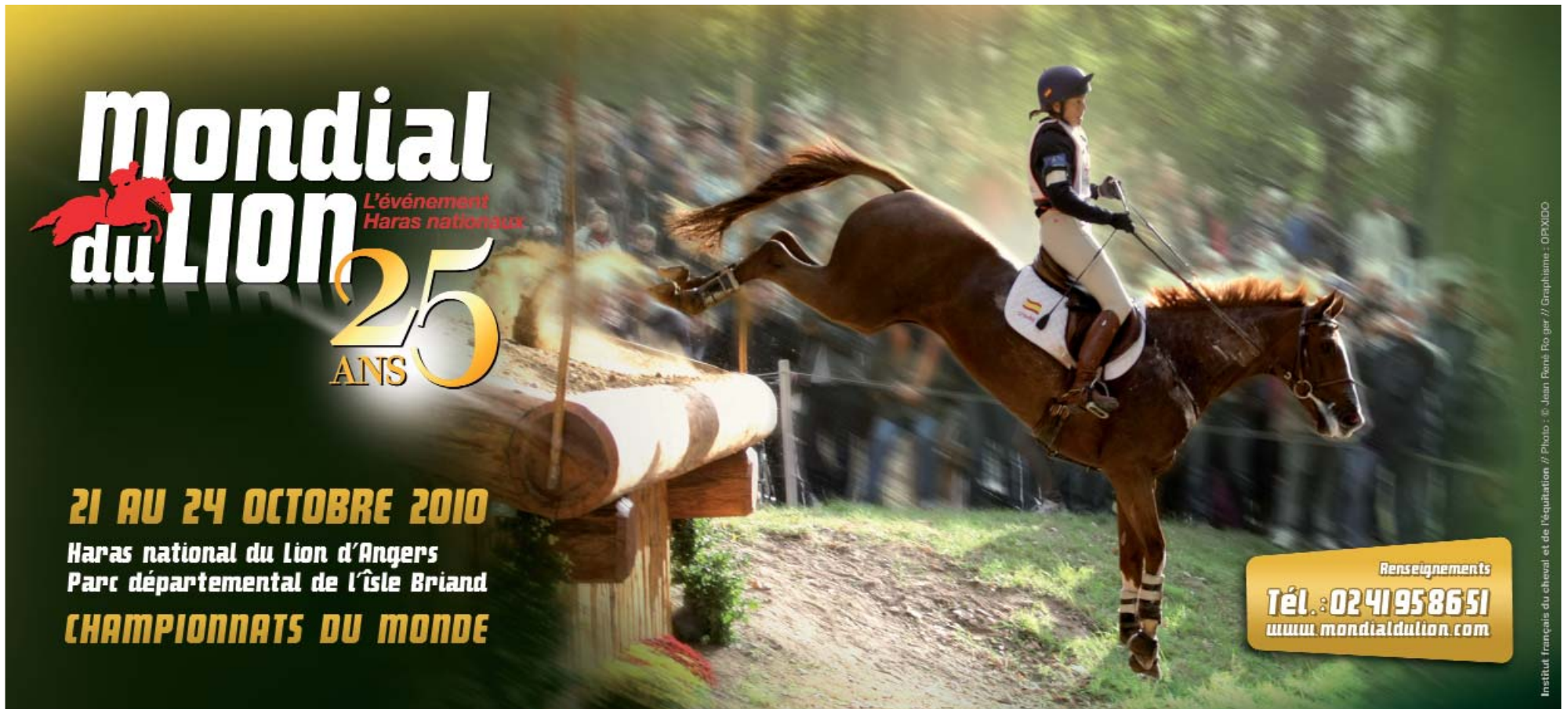
Institut Français du cheval et de l'équitation // Photo : © Jean-François Rogier // Graphisme : DP&XICO